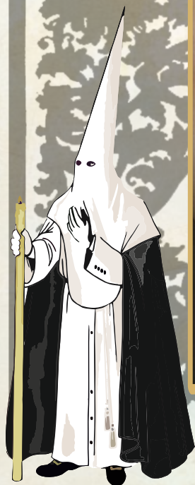
HDAD. DEL SANTÍSIMO CRISTO DE LA EXPIRACIÓN